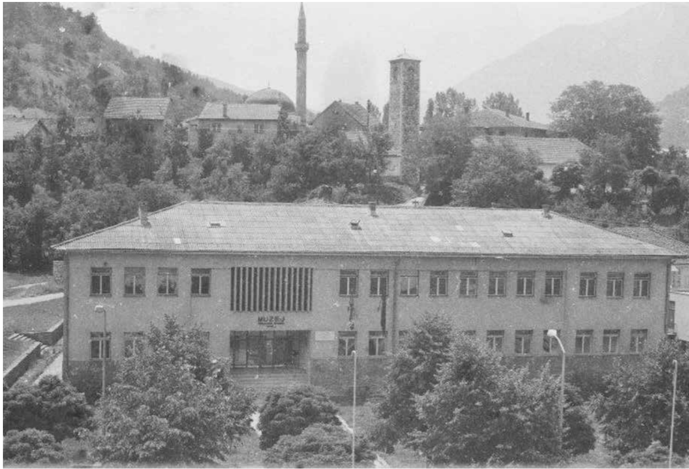
Фоча - Поглед на Сахат кулу