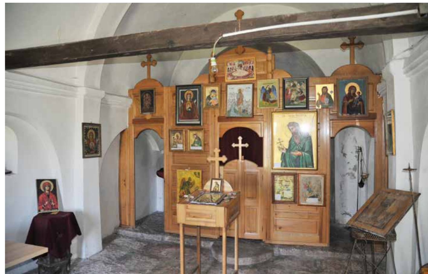
Иконостас цркве на Борковићима