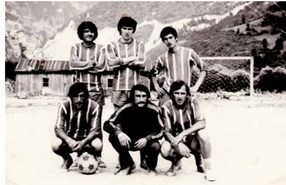
Ђетићи - 1973.

Врбници, али смо се увијек враћали мосту и вировима живота, лукама, а изнад свега Кањону и планини.