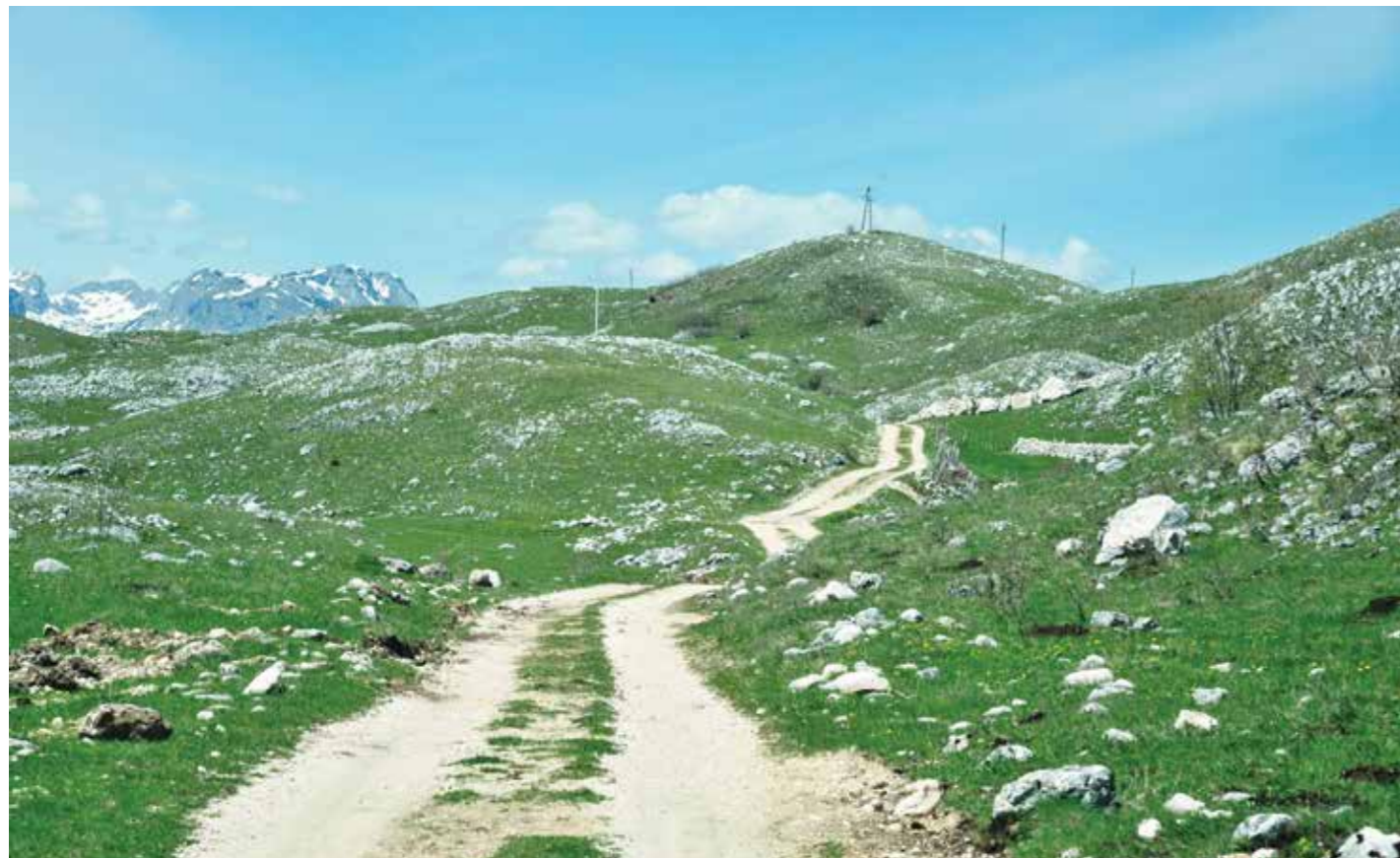
Пут ка Боричју

која се водила на овим просторима. Да су се тада Немци пробали, дошли би до Безуја и хаубицама гађали Брезна да спријече чувену велику евакуацију рањеника авионима