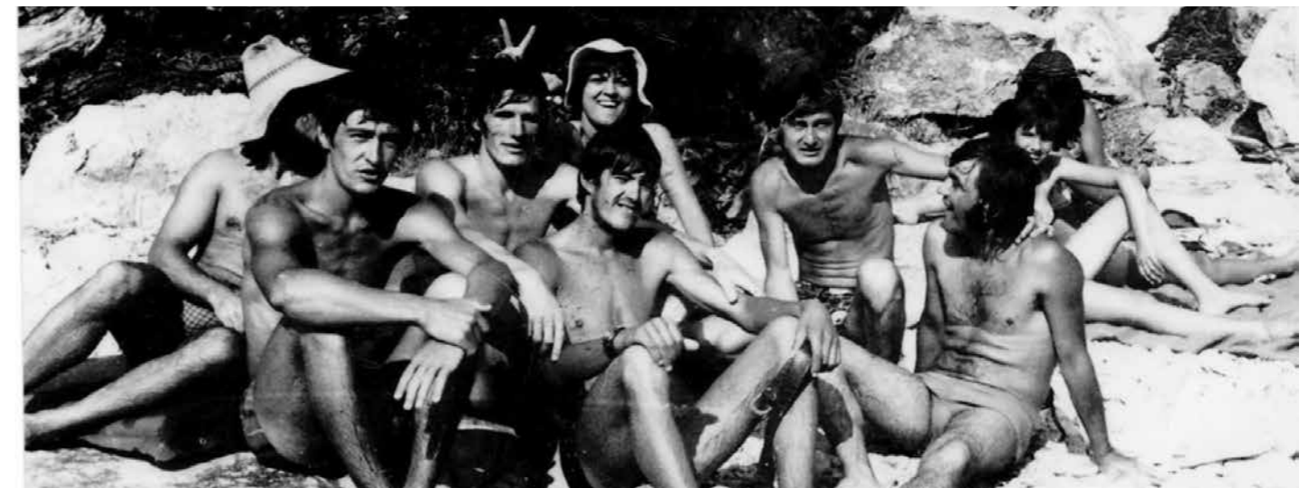
Екипа проф. др Драгослава Срејовића - 1973. археолошко истраживање