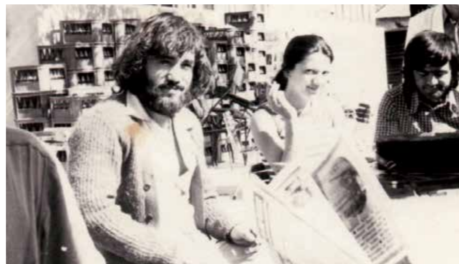
Тераса Хотела Пива - 1973.

Митром и другима. Било је то љето за незаборав. Ми смо увијек одлазили у свијет са дрвеног моста на