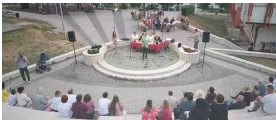
Са прошлогодишње манифестације

-Портрет пјесника Живојина Ракочевић, митинг поезије и традиционални програм с пјесником у поноћ.