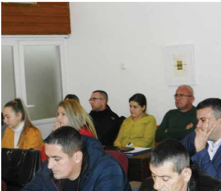
Са једне од ранијих сједница локалног парламента