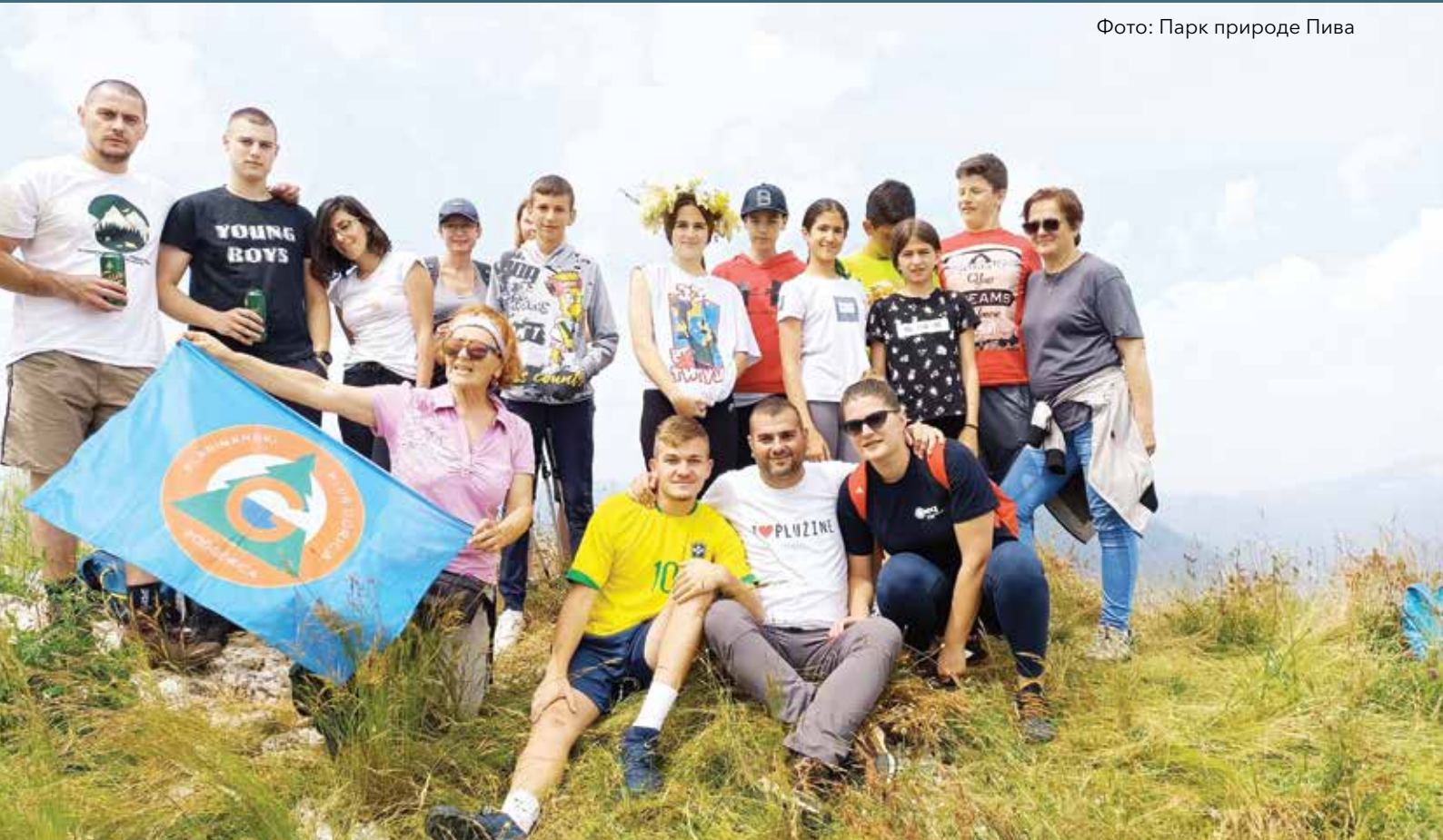
Фото: Парк природе Пива