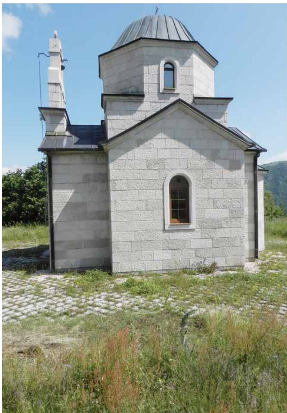
Црква Светог Јована Крститеља у Сељанима