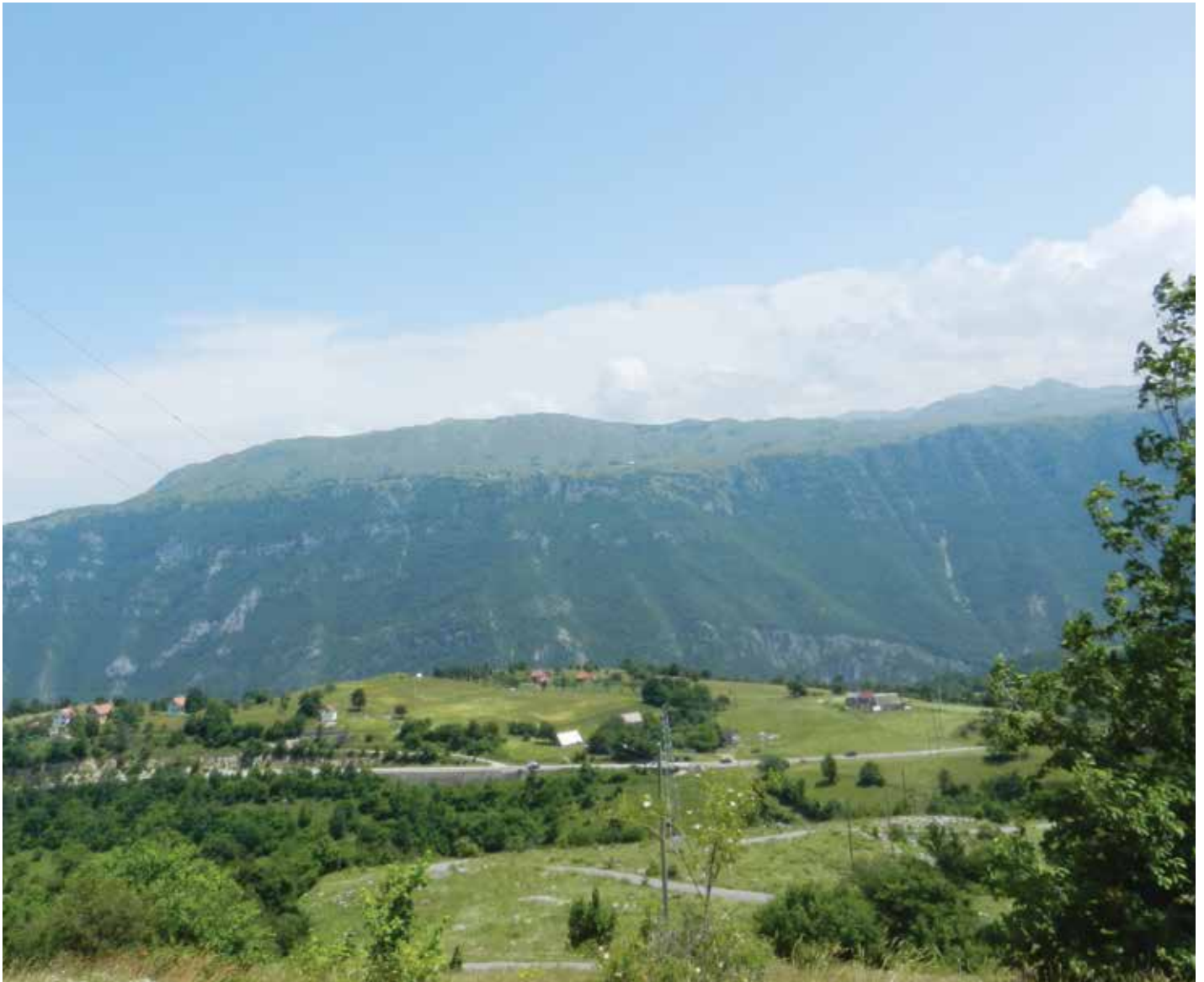
Поглед на Сељане са Закамена