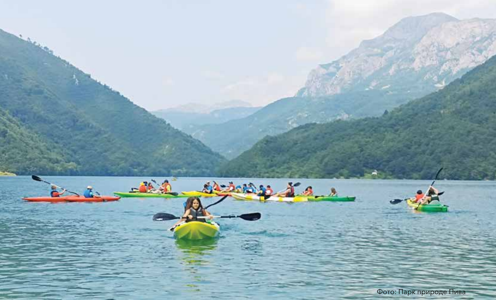
Фото: Парк природе Пива