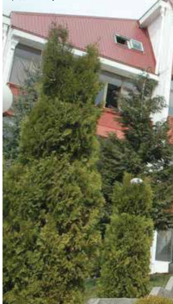
Зграда СО Плужине

тако враћа у Боку 1684. године. Бајо Пивљанин 1685. године на наређење Антонија Зена, као помоћ Црногорцима, припрема одбрану Цетиња од Османлија. До сукоба је дошло на Вртијељци 8. маја 1685. године, гдје Бајо Пивљанин гине бранећи Цетиње од вишеструко бројније тур-