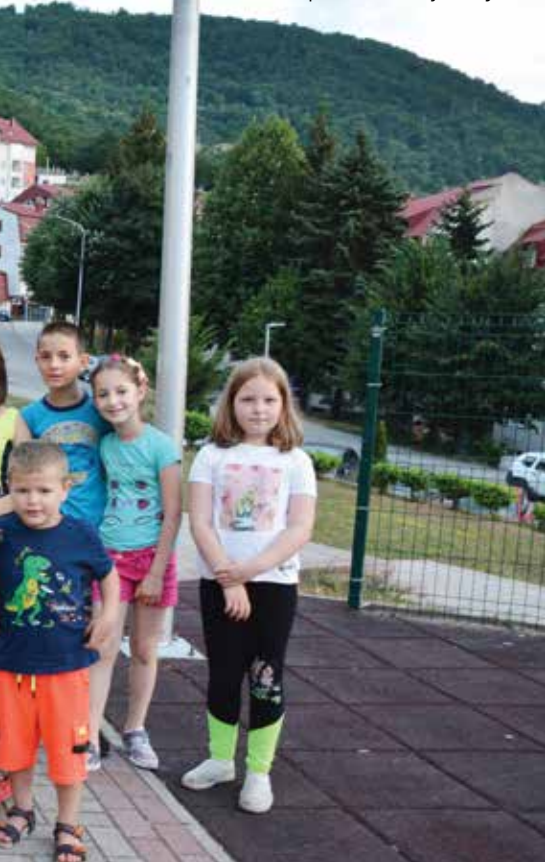
Општина Брине и о најмлађима

година и ове школске године обезбиједили смо школске торбе за ђаке прваке. Додјељујемо награде добитницима дипломе Луча и ученицима који су освојили једно од прва три мјеста на олимпијади знања, државним такмичењима знања и спортским државним такмичењима. Обезбјеђујемо и помоћ у суфинансирању трошкова оплодне уз помоћ асистираних репродуктивне технологије (вантјелесна оплодња).