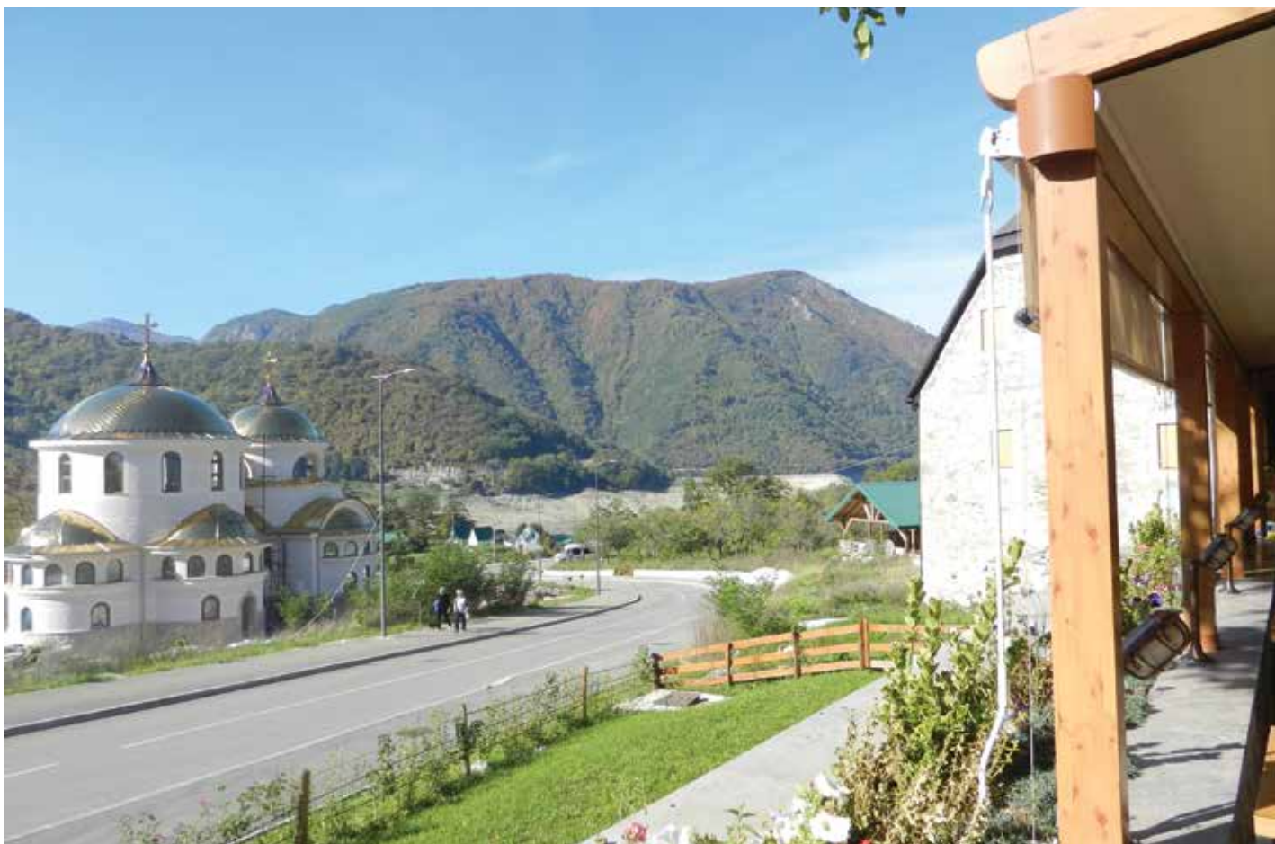
Поглед на храм са терасе Сочице