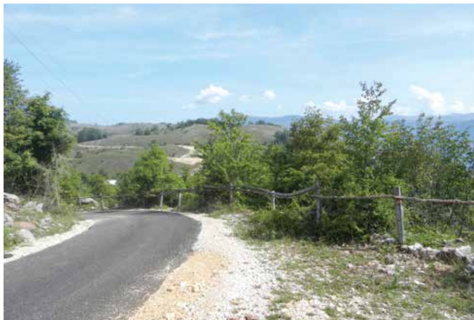
Асфалт и до Горњег Стоца

Путна инфраструктура представља основни потенцијал развоја