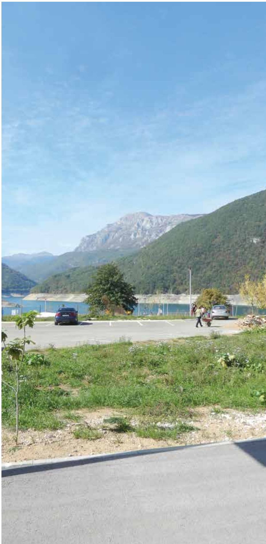
Низак водостај језера не годи туристима

језеро и планине, а наш је утисак да су власници са много рада успјели да помјере стандарде у туристичкој понуди Пиве.