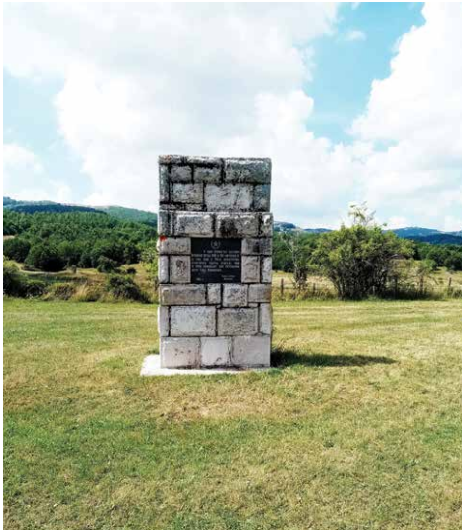
Споменик на Муратовици подигнут у знак сјећања на формирање 5. црногорске бригаде