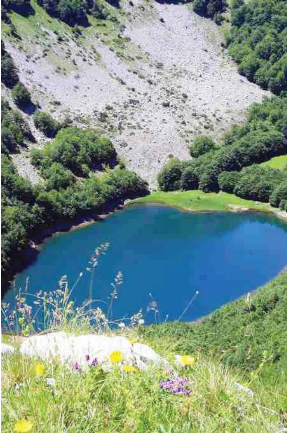
Велико Стабанско језеро