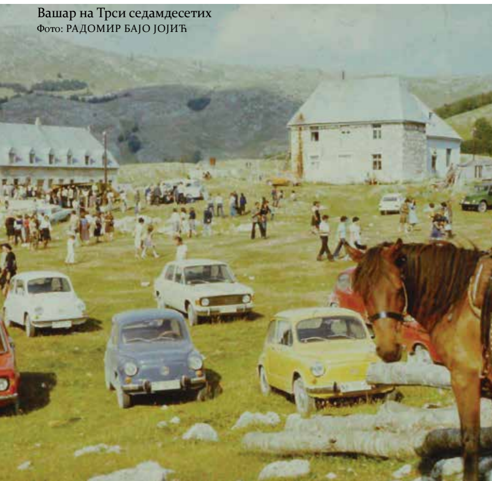
Вашар на Трси седамдесетих