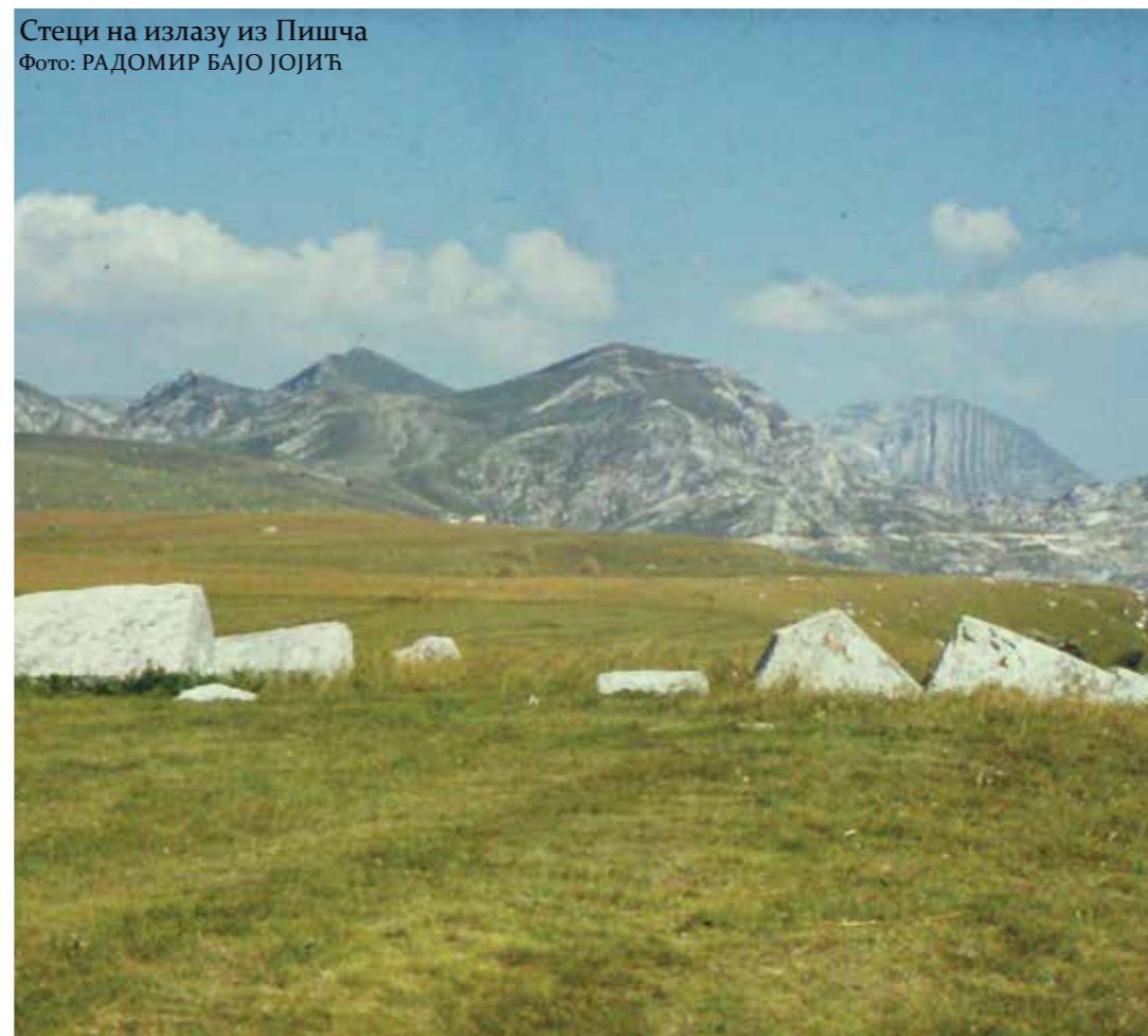
Стеци на излазу из Пишча