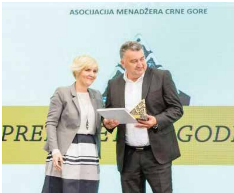
ASOCIJACIJA MENADŽERA CRNE GORE