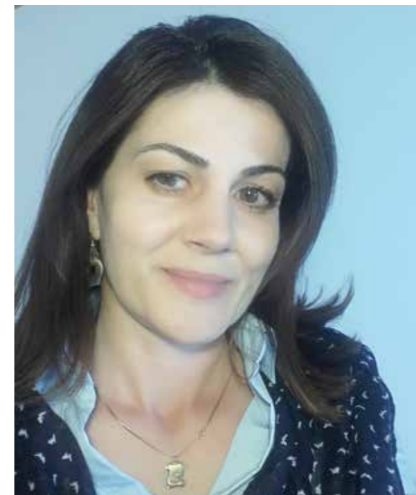
Пише: Љиљана Вуковић

Али мојом Пивом све више влада мук. Боли њена тишина, а посебно када у сутон примјетим да је све мање осветљених кућа.