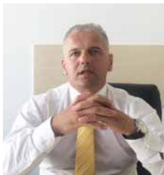
Пише: Раденко Дамјановић

Свака трагедија, умјетничка или стварна, имала је и има свог трагичног јунака. Ни наша пивска, највећа у историји думиторских крајева, није била изузетак. У тој трагедији сваки страдалник је истовремено био и трагични јунак и ми не би имали право, ни слободу, да некога посебно издвајамо.