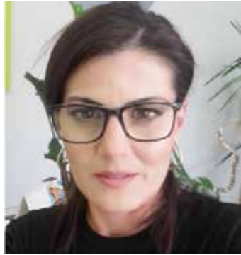
Пише: Љиљана Вуковић