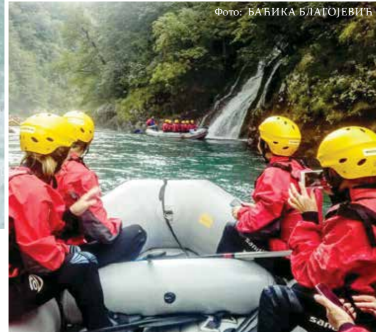
Фото: БАБИКА БЛАГОЈЕВИЋ