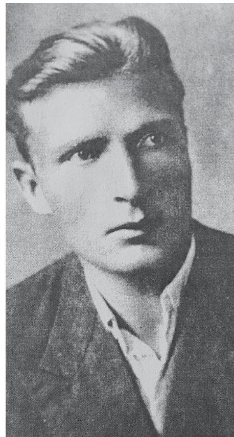
Бождар Тадић из студентских дана