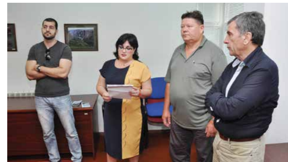
Са прошлогодњих књижевних сусрета