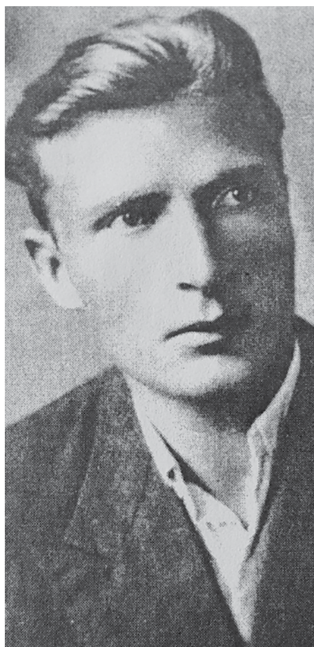
Бождар Тадић из студентских дана