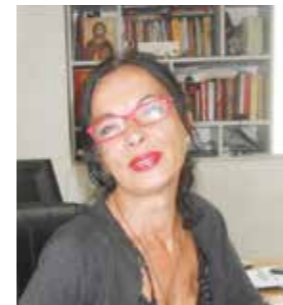
Пише: Весна РАДОЈЕВИЋ

Б режњани су се протекле јесени увјерили да заједничка борба, за опште добро, за исправне циљеве, вјера и стрпљење, на крају, дају и резултат.