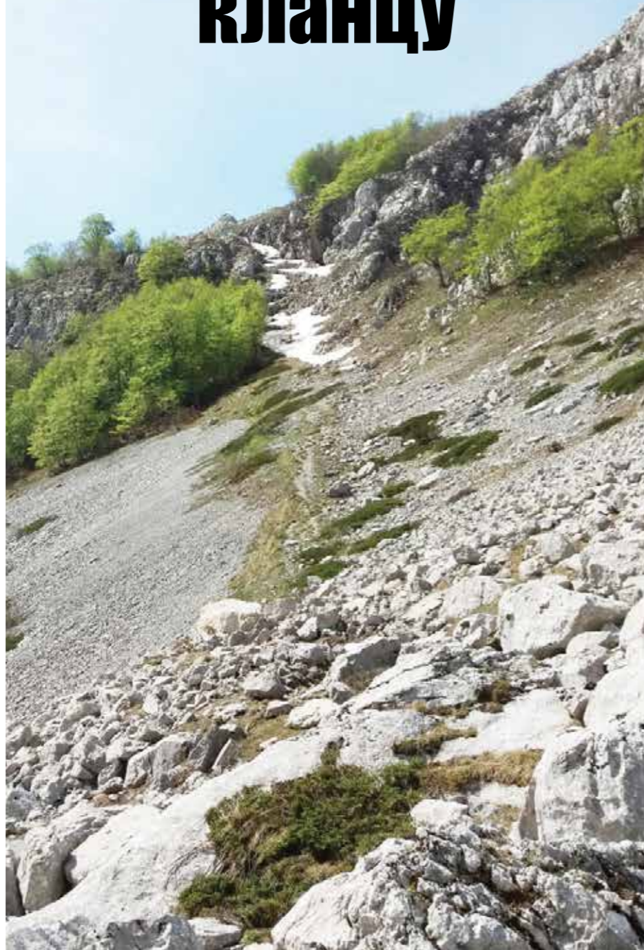
Пут преко ждријела посматран из Љуботиног кланца

Када се од пивског села Стубица крене ка западу, у смјеру крупног источног планинског чворишта високохерцеговачког карста, уз црногорску границу представљеног Волујаком, најприје се изађе на плато Брштевца. Овдје су од давнина смјештени љетни станови житеља Стубице, а у новија времена и села Јасена које је раније изгонило на Латично. На западној страни предии је затворен кршевитим гребеном Орловца. Овдје постоји жива грађена вода „Марушица“, а раније и Брштевачка локва која је пропала. На овом платоу лежи старо гробље које би могло припадати 16-18. вијеку. Сјеверније се уздиже Влашка продо и високи гребен преко кога води пут ка Волујаку и Љуботином кланцу у чијем дну се налази опширни ћирилички натпис који овдје објављујем. Натпис је уклесан старим ћириличким писмом на српском језику.