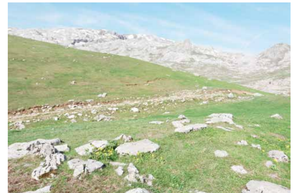
Гробље на Брштевцу

Натпис у Љуботином кланцу представља драгоцјен споменик средњовјековне прошлости Пиве. Говори и о високој култури личности која је изградила пут између драгоцјених извора воде. У дијелу ждријела гдје је пут изведен преко точила, обезбјеђен подзидама, он је захтијевао највећа напрезања његових градитеља. Коначно, зашто не истаћи, овај натпис свједочи напоре наших предака да живот човјека на оштром динарском кршу учини лакшим. Није, дакле, само османска или аустријска власт донијела градње путева. Изведен средствима онога времена (15. вијека) овај планински пут представљао је изузетан градитељски подухват.