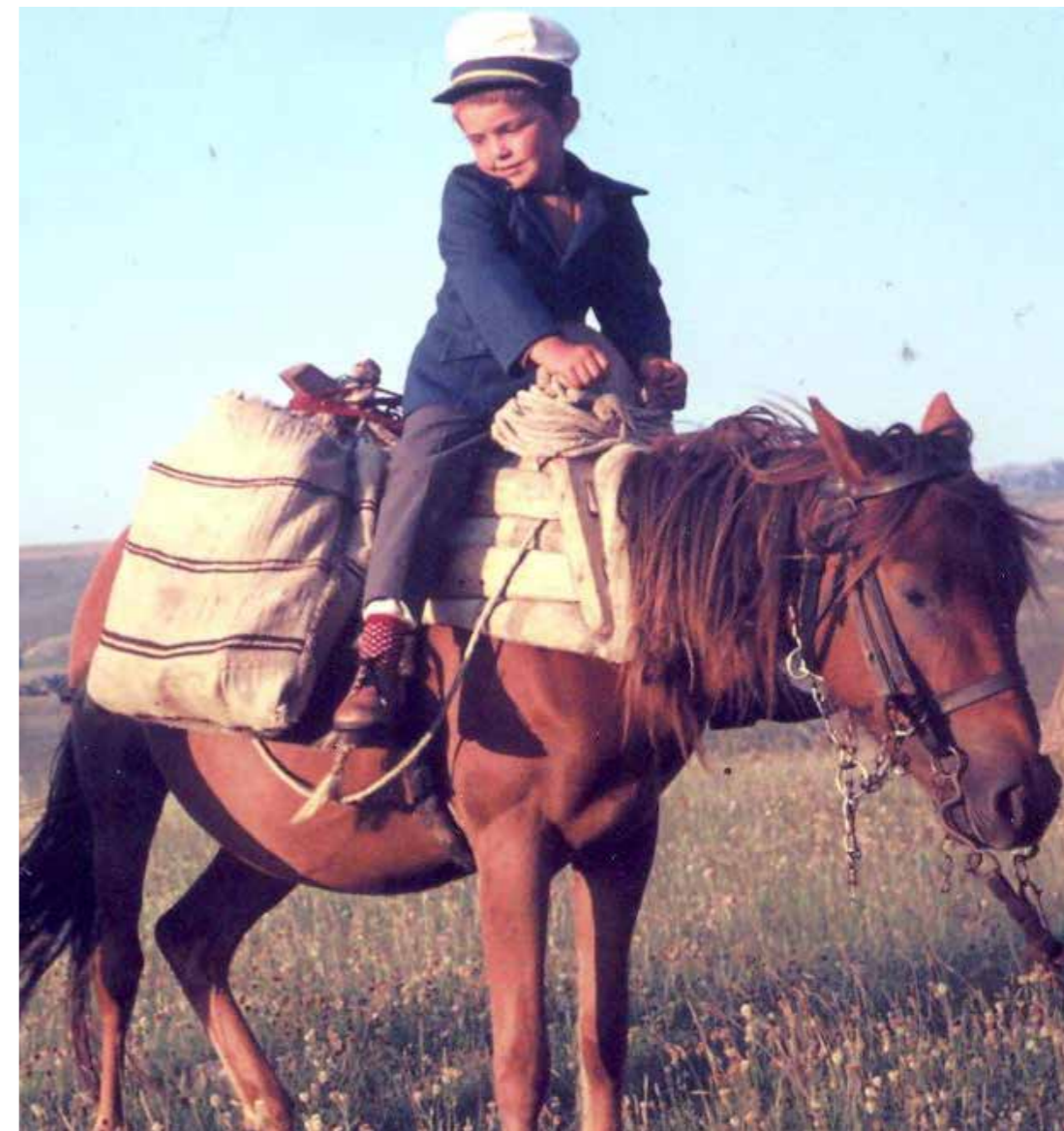
Дјечак на коњу