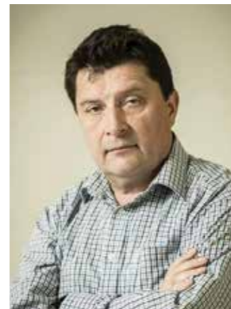
Пише: Радмило ТАДИЋ

Била је то љубав на први поглед. Срео сам је у банци. Другар за шалтером протежирао је да је прихватим и рече: Мало тражи, а нуди много. Заљубио сам се – била је плава онако витка и еластична – била је дивна. Прошло је више од десет година, а ја се ње радо сјећам.