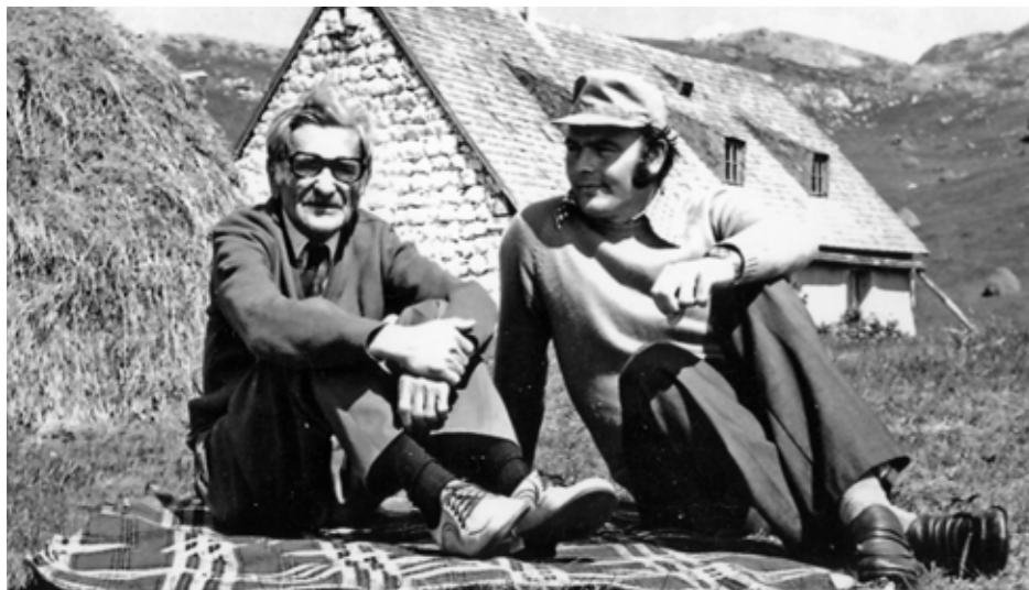
Академик Јован Вуковић у Пишчу