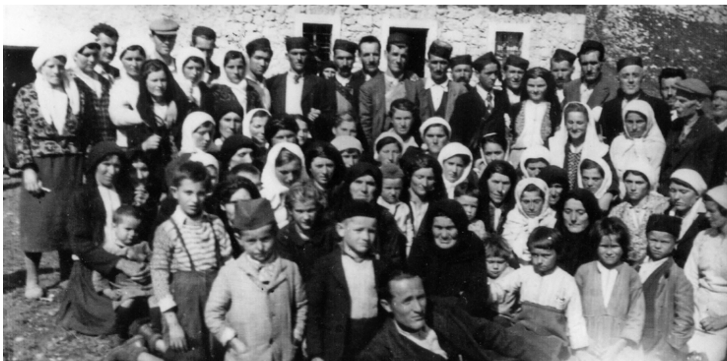
Свадба 1947. на Пишчу