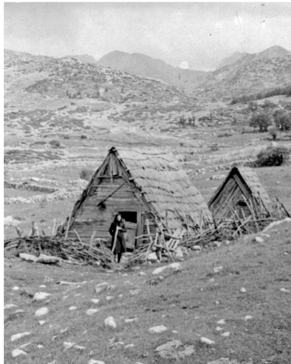
Катун Војиновица село Пишце, 1973. године