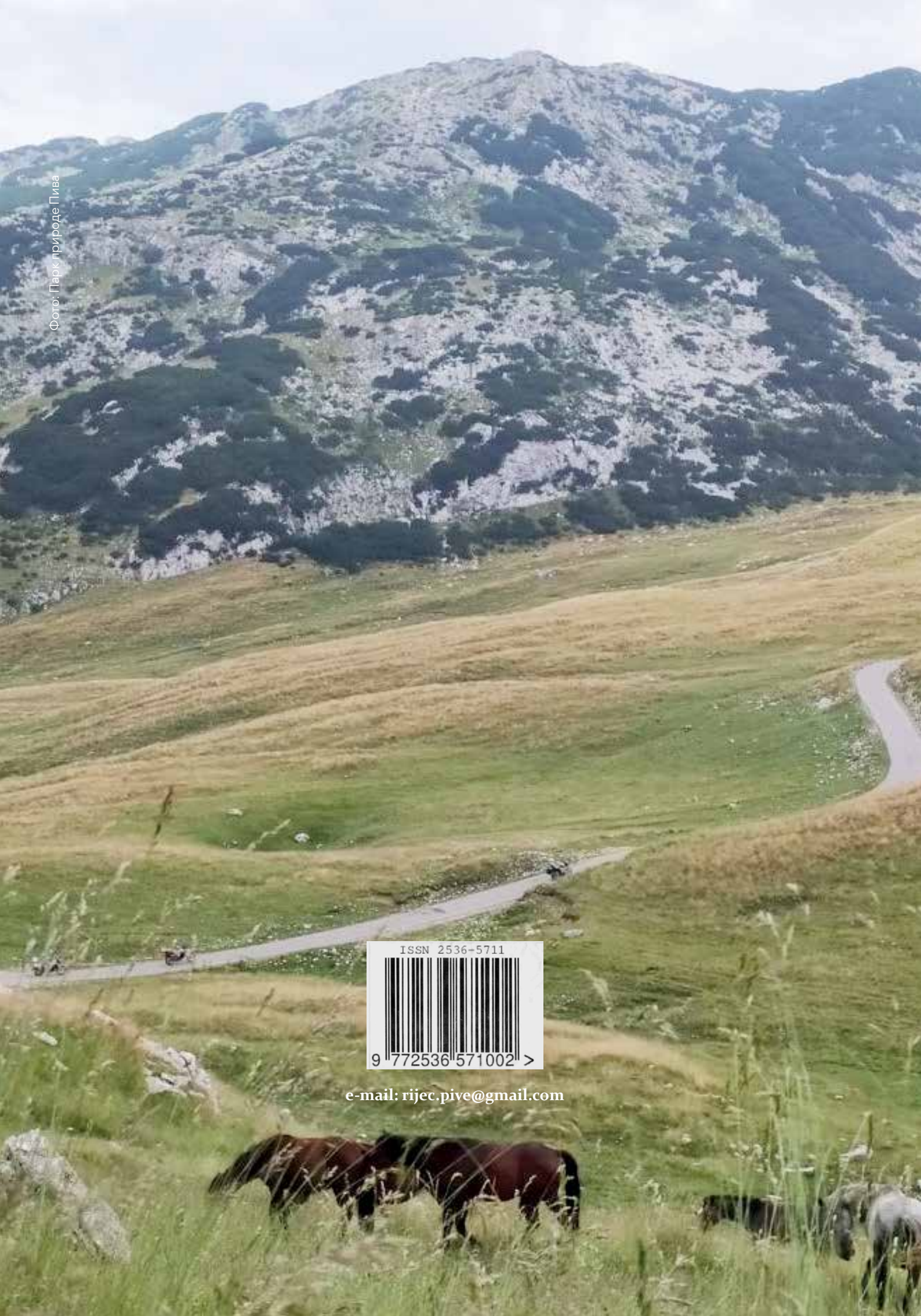
Фото: Парк природе Пива