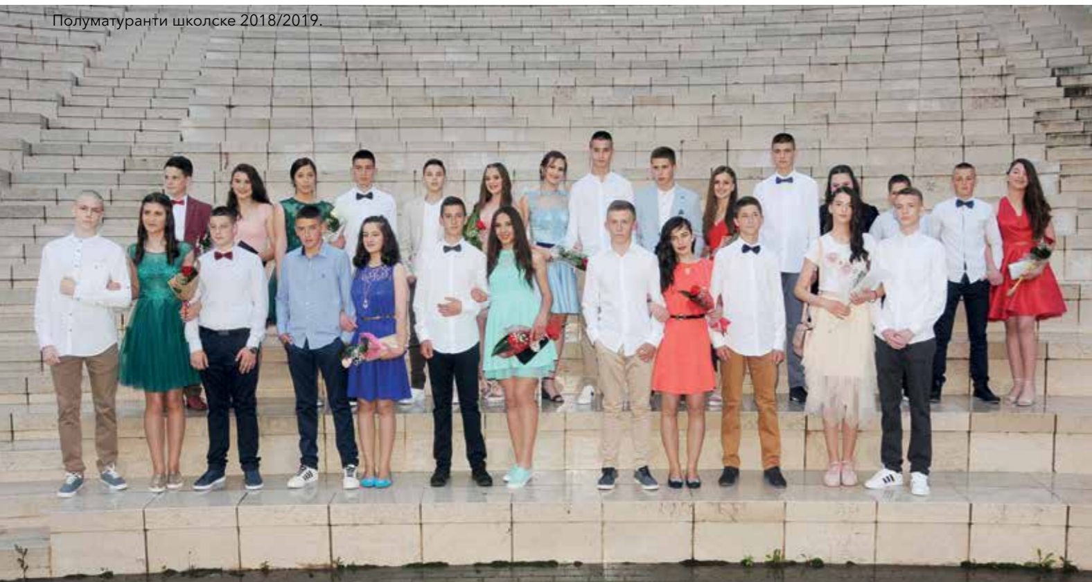
Полуматуранти школске 2018/2019.