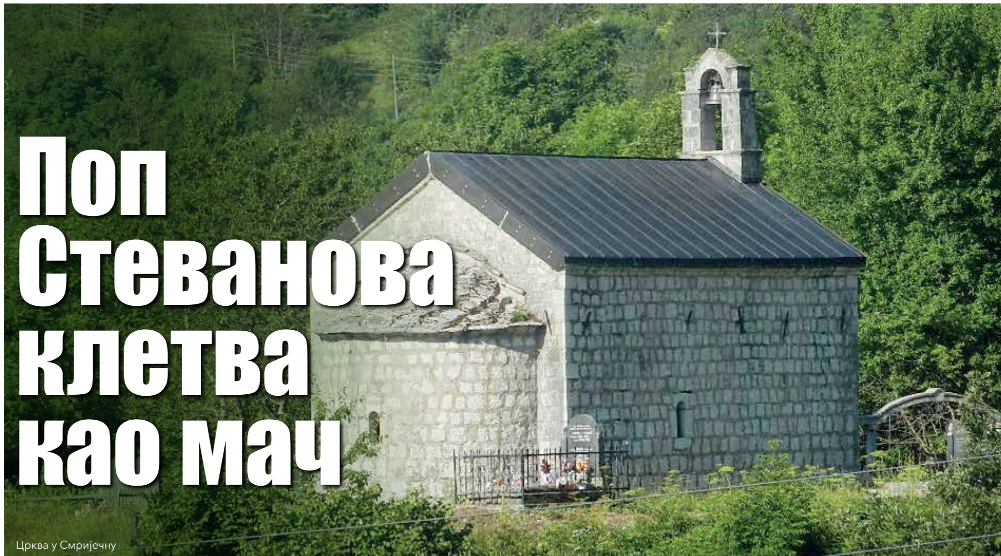
Црква у Смријечну