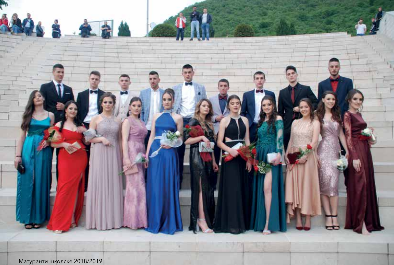
Матуранти школске 2018/2019.

ције енглеског и руског језика, као и историјско – географска секција. Ученици су, у складу са својим афинитетима одабрали оне које им дају могућност да се што боље изразе, развију и покажу своје таленте.