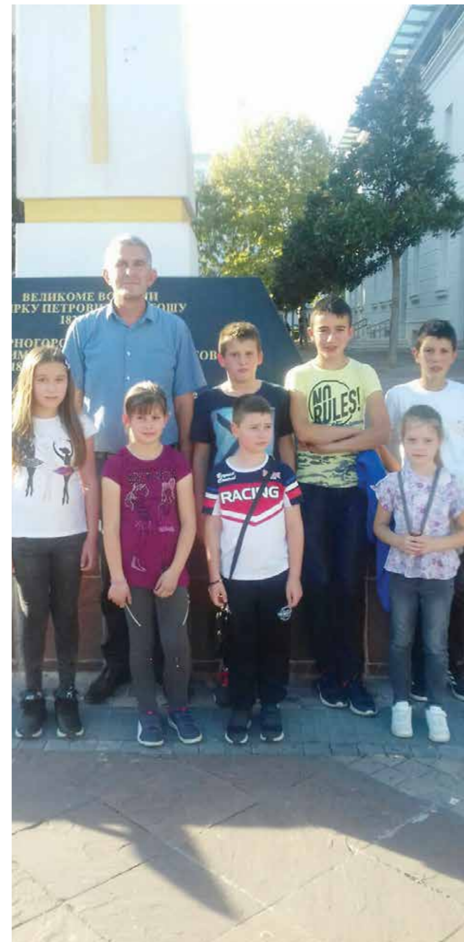
Ученици ОШ Бећко Јововић школске 2019-20 на излету у Подгорици