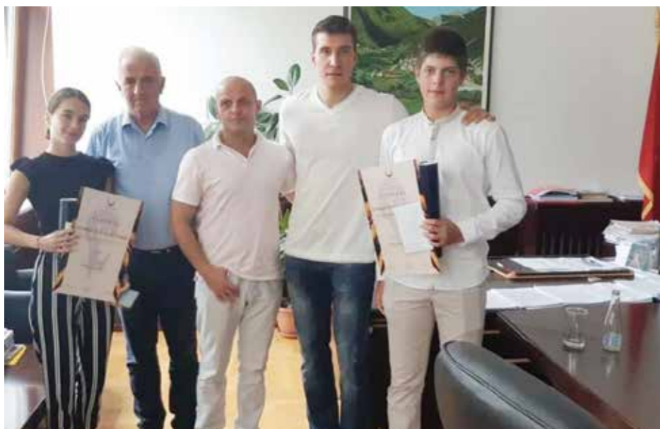
Пријем код председника Општине