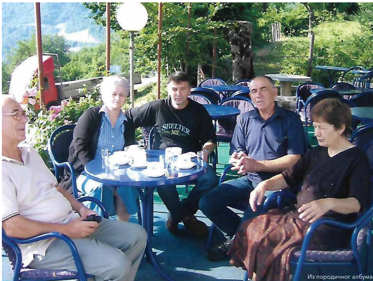
Из породичног албума