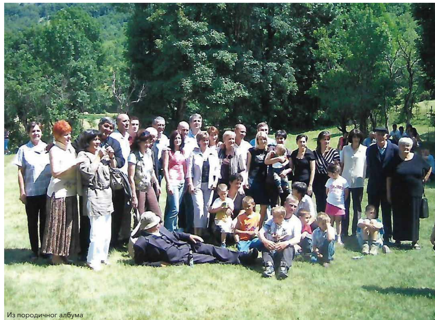
Из породичног албума