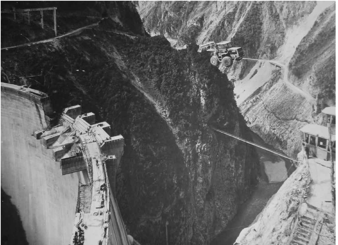
Градња Хидроелектарне -