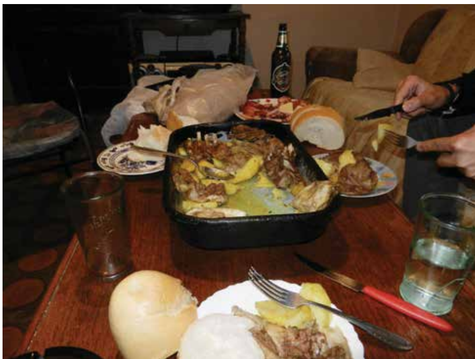
Домаћински ручак у Мратињу