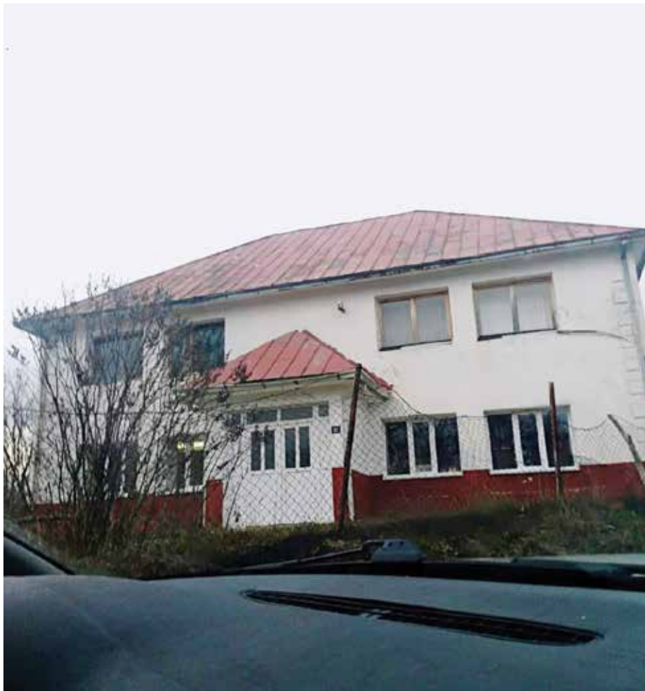
Школа на Горанску

"Дај те друже војску" "Сандока на боли глава", "Везени пешкири", "Ђаво с неба" "Ластикаш" само су неке од игара које смо играли на великом одмору испред школе. Били смо срећни, није нам за срећу пуно требало. Највише смо се радовали Изетњаку и часовима у природи, приредбама и задње године маскембалу. Вољели смо да се попнемо на чатрњу и цртамо кулу Војводе Лазара Сочице, да се утркујемо ко ће боље нацртати његов ђефердар. Скупљали смо кестене, пребројавали и дијелили . Размјењивали смо вијести из села, оговарали нечије овце и критиковали једног сеоског пса, који је највише воли да спава на улазним вратима школе.