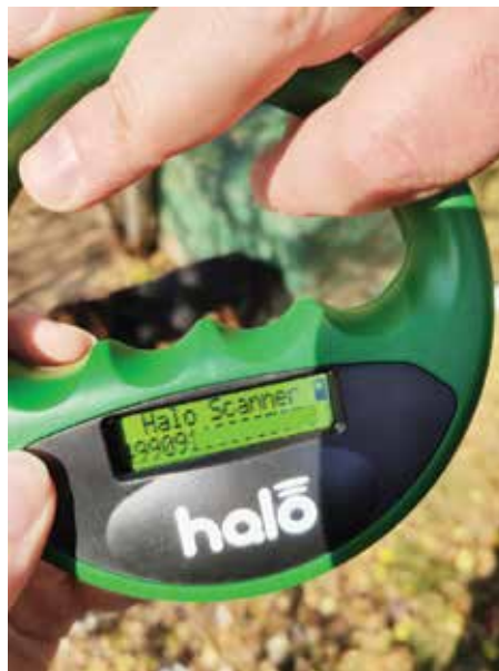
Чиповање паса у Плужинама

али га могу имати у сарадњи са ветеринарским службама у својим општинама.