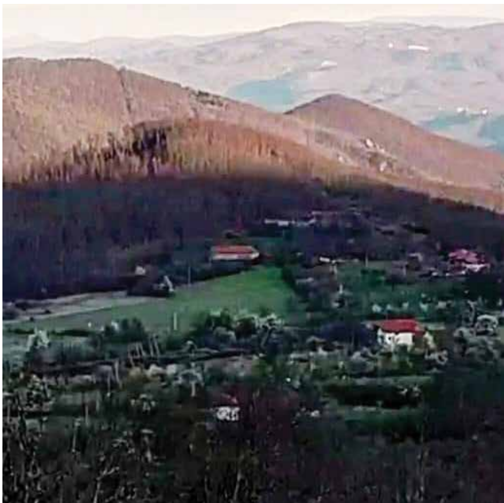
Насеље Гајтан насељено Пивљанима током XIX и првом половином XX века