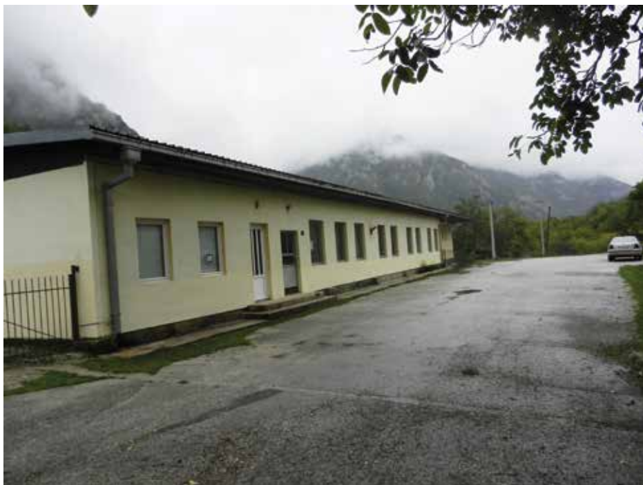
Дом у Мратињу