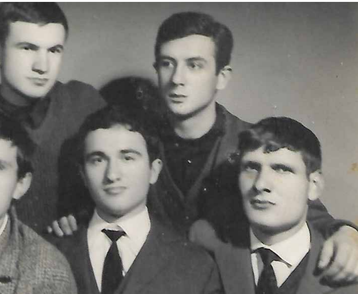
Студенти из Пиве у Београду, мај 1963.године

1758 – Филип Кецојевић: 9 душа; Глиго Кецојевић: 8 душа.