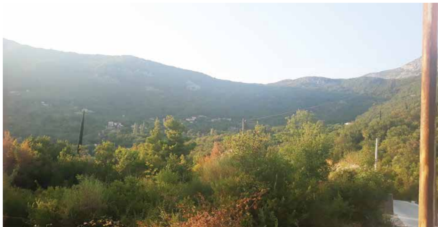
Мојдеж - Насеље код Херцег Новог у којем Кецојевићи живе од 1701. године