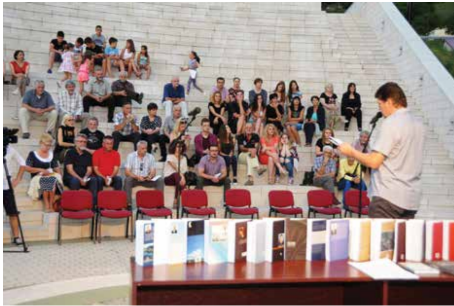
Ријеч на извору Пиве траје пола вијека