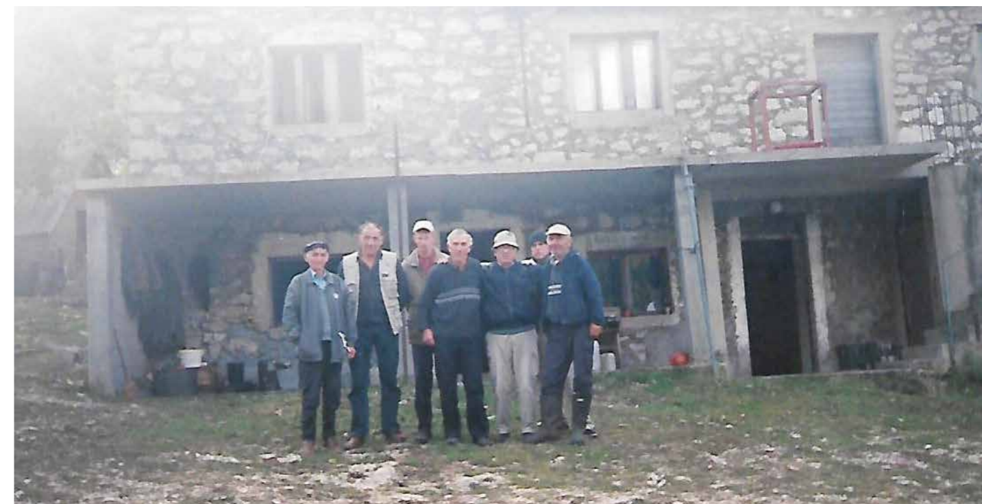
Сустрет братственика у Боричју