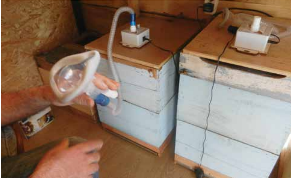
Инхалатори на кошницама

одакле пчеле долијећу и послије неког времена дођете до стабла у којем живе. Потом се дрво шега испод и изнад мјеста у којем су пчеле и