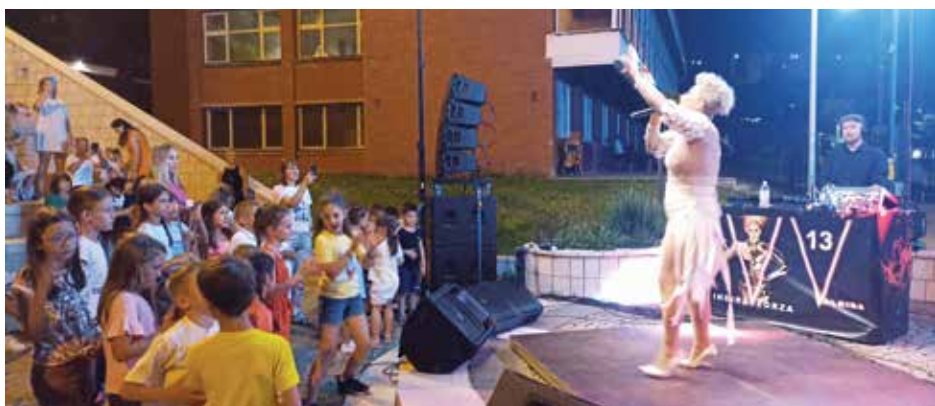
Концерт групе Колонија

сле њих Валентино, једна од најпопуларнијих поп-рок група са простора бивше Југославије.