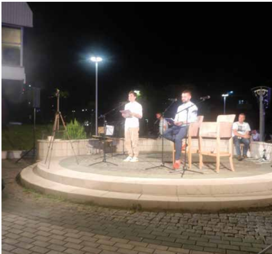
Пјесничка ријеч на извору Пиве