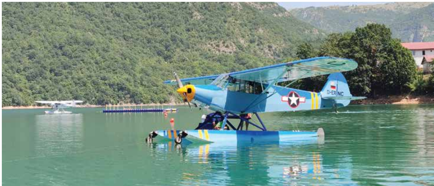
Хидро авио регата

„Пивска прича 2023.“ је манифестација коју Општина Плужине и Парк природе „Пива“ спровode већ трећу годину за редом а у склопу које се организује низ концерата током љетњих мјесеци.