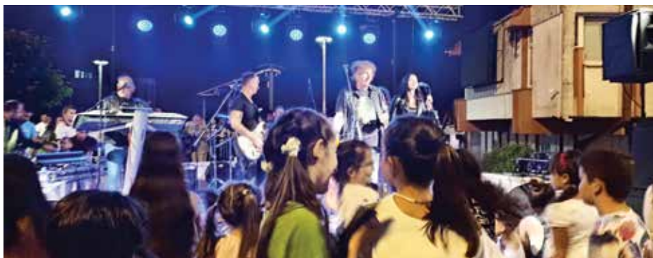
Концерт групе Валентино