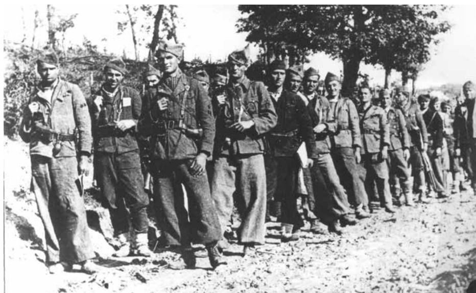
Партизанска чета: Борба за Ливно