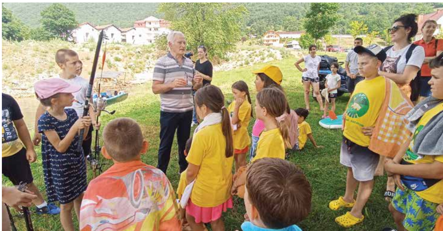
Дани Пивског језера