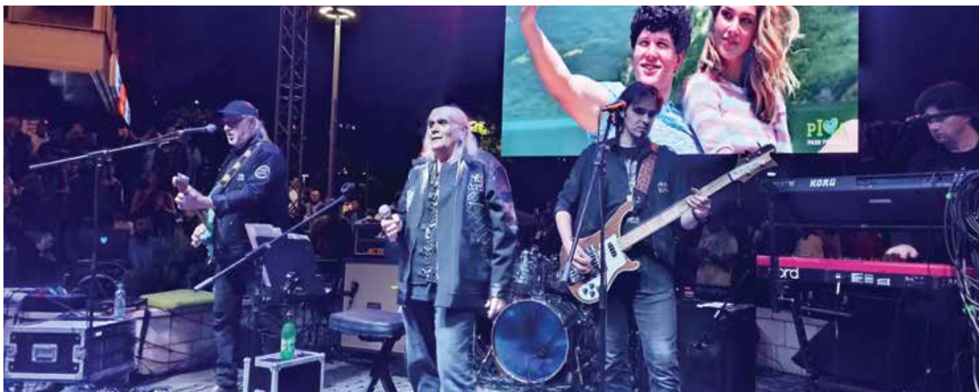
Концерт групе Рибља чорба