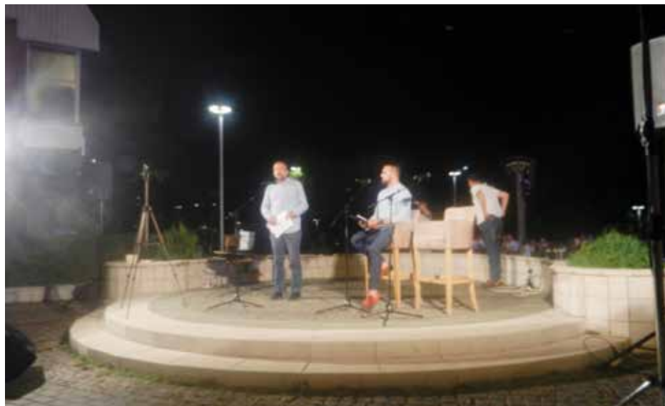
Пјесничка ријеч на извору Пиве