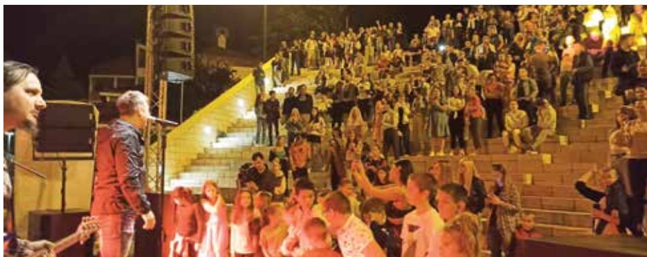
Концерт групе Лексингтон