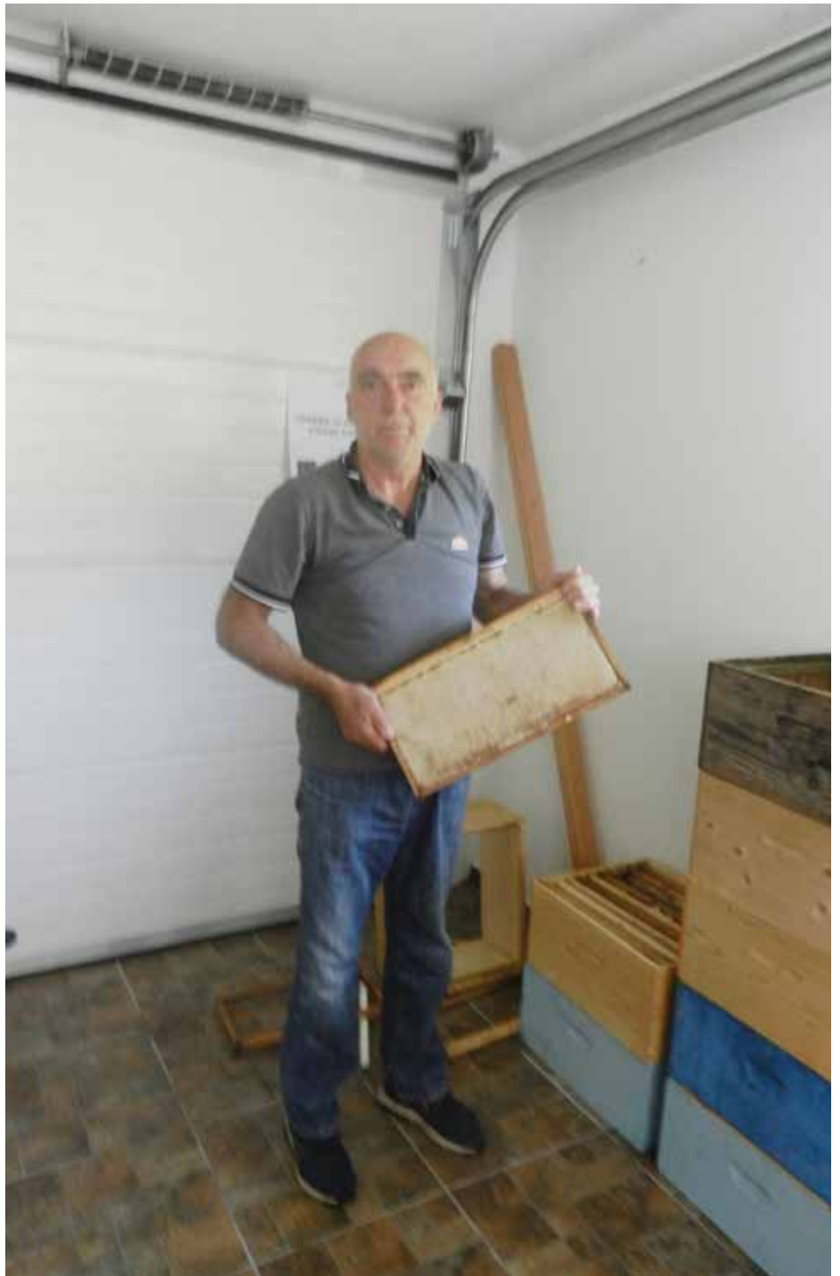
Митрић: Ове године рекордан принос меда

-На ливади се остави мало меда на сатној основи и ухвати се неколико пчела које се донесу до меда. Оне убрзо лете ка свом роју и обавјештавају гдје се налази мед. По времену које утроше од доласка до повратка са „појачањем“ зна се да ли је дубина у којој је рој близу или далеко. Потом се мамац помјера у правцу