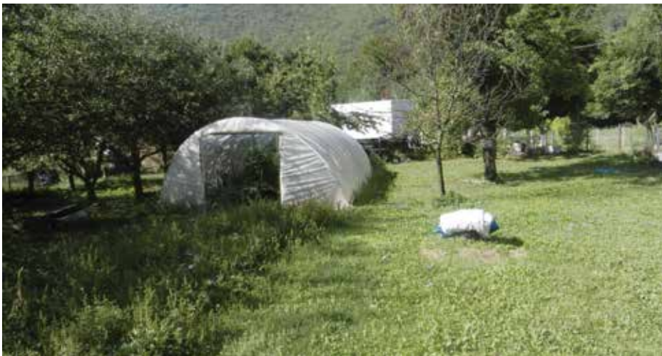
Органска производња на имању Митрића

О тајнама пчеларства могло би се са Жељком причати сатима, али