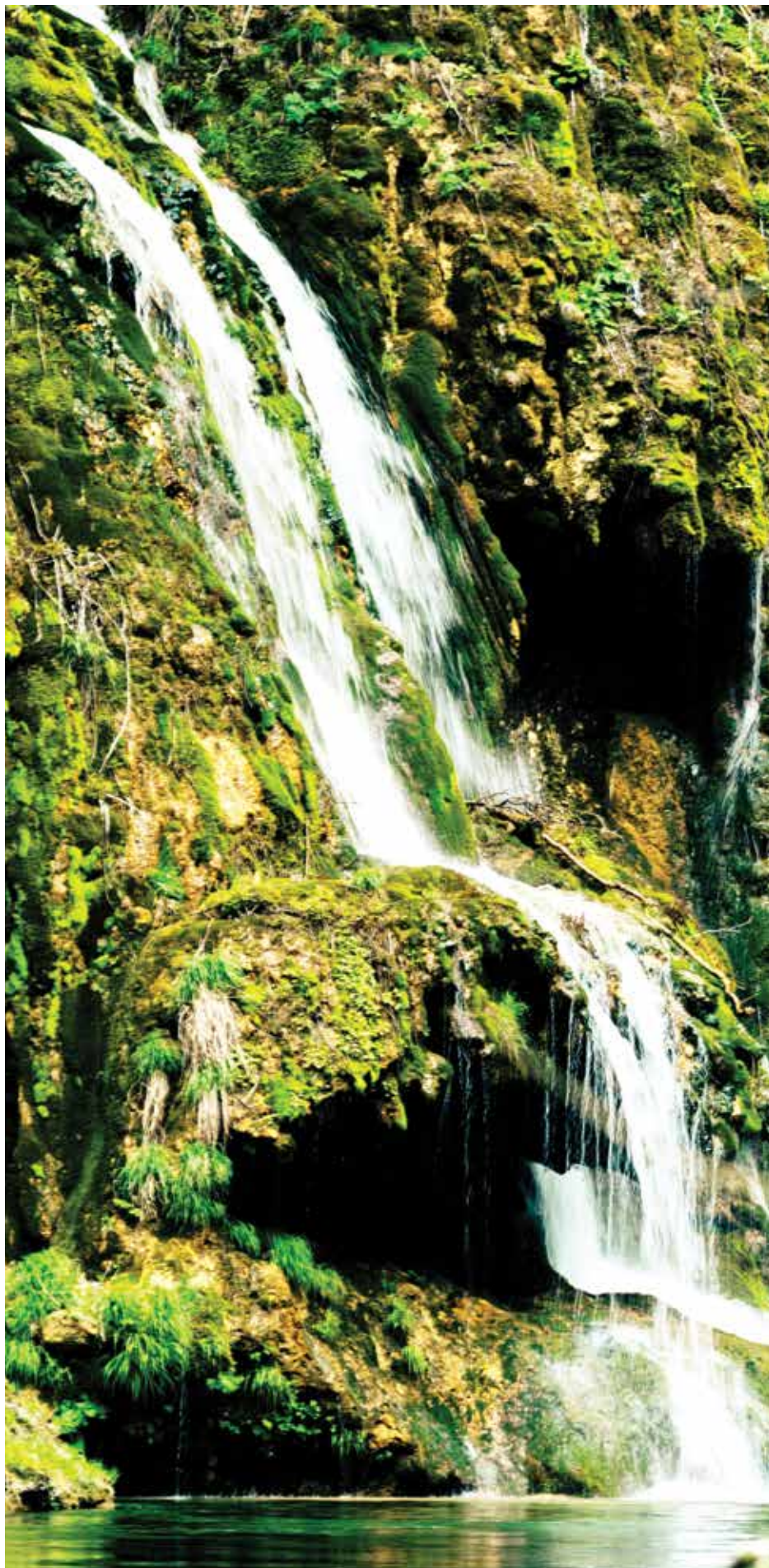
Водопад Комарнице

иницијативе против изградње војног полигона на Сињајевини, али и изгубила нешто од поверења зелено оријентисаних гласача због недовољне одлучности у заустављању еколошки штетних пројеката. Зато је Абазовићево обећање активистима да Влада Црне Горе на Комарници неће предузимати никакве кораке који би били штетни по животну средину примљено са резервом.