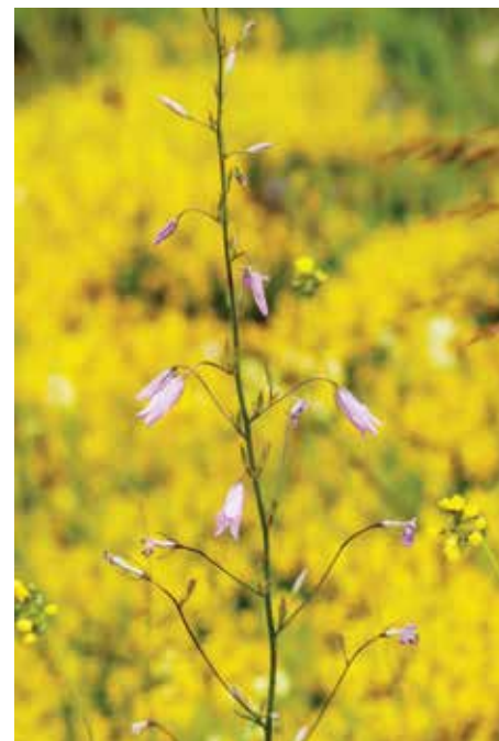
Цвијеће Комарнице - Фото: Јелена Поповић