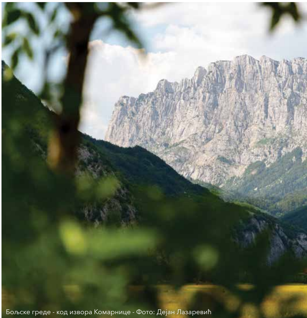
Бољске греде - код извора Комарнице

Активисти тврде да је исплативост експлоатације ХЕ спорна и без упоредбе са алтернативним пројектима. Они истичу да су процене о томе да ће она коштати око 300 ми-