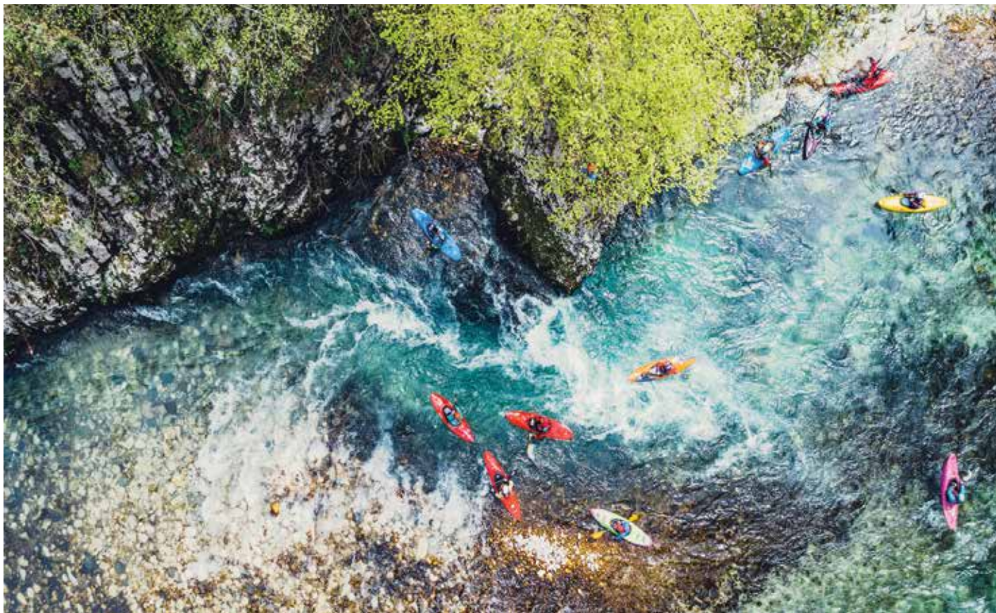
Кајакаши Комарнице