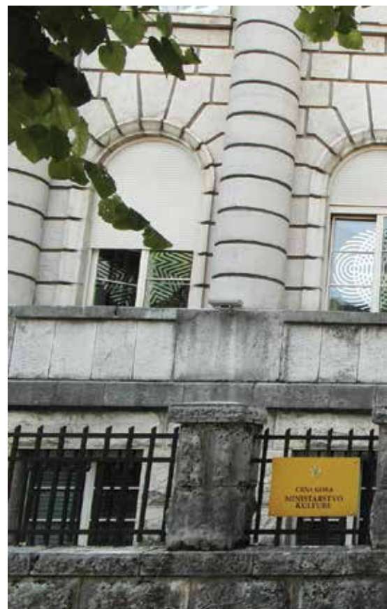
Министарство културе и медија