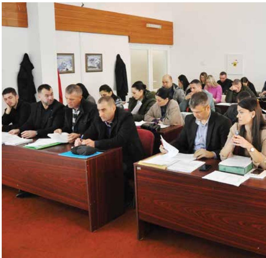
Са сједнице СО Плужине

Да закључим, најважнији ресурс су људи, и морамо сви заједнички уложити максимум напора да Пива оживи, да задржимо младе људе и да покушамо да се у наредном периоду један број људи врати у Пиву. Потребно им је обезбиједити да имају исте или макар сличне услове као њихови вршњаци у другим градовима, више садржаја за младе, за тинејџере за дјецу. Да и наша дјеца имају парво на промоцију тек објављеног цртаног филма а не да чекају годину или двије да виде тај исти цртани. Јер цаба нам све ако се не чује дјечији осмјех на игралиштима, ако немамо довољан број дјеце за школе и вртиће. Цаба нам сво ово богатство ако не вратимо младост, шта ће нам богатство ако иду млади, ако иде будућност. Морамо се потрудити сви, без обзира за политичка одређења и разлике да их вратимо. Ово су њихове куће, њихова ђедовина и огњишта, њихове Плужине и њихова Пива.