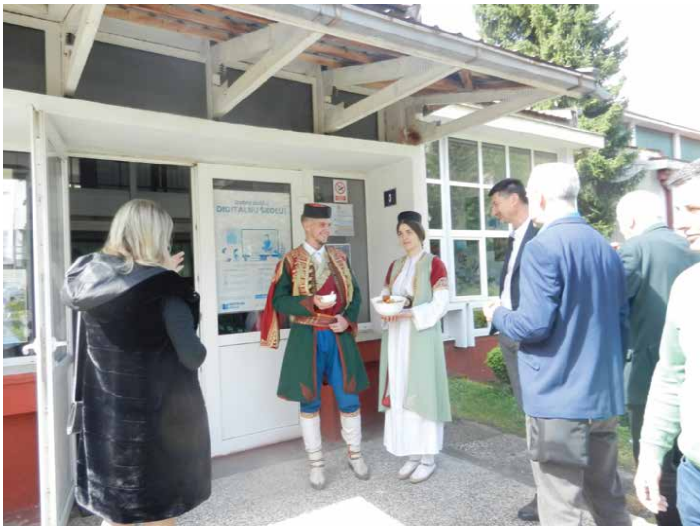
Почетком маја пригодном свечаношћу на којој су наступили ђаци свих генерација обиљежен је Дан Образовног центра у Плужимама, а неколико дана касније и Дан ОШ „Бећко Јововић“ у Стабнима. Овом приликом објављујемо фотографије са тих свечаности.