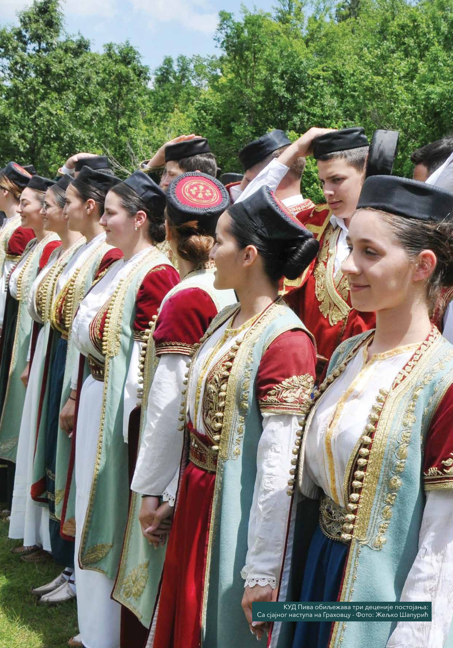
КУД Пива обиљежава три деценије постојања: Са сјајног наступа на Граховцу