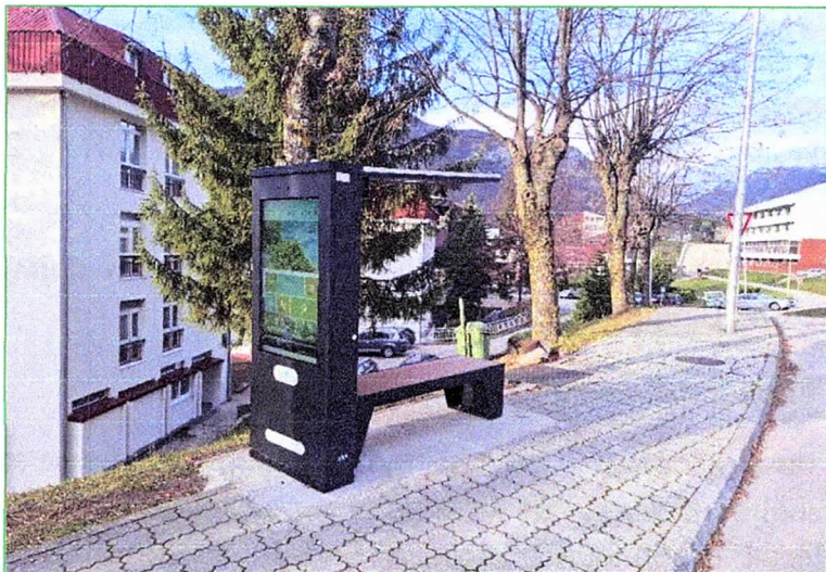
Фотографија 4: Интерактивна соларна клупа у Плужинама постављена 2025.

омогућава пуњење мобилних телефона путем USB прикључка и бежичног пуњења, емитује Wi-Fi сигнал и приказује податке о датуму, времену, температури и квалитету ваздуха, као и могућност фотографисања. На интерактивном дијелу доступне су информације од значаја за туристичку дестинацију и Парк природе „Пива“, као и основне сервисне информације.