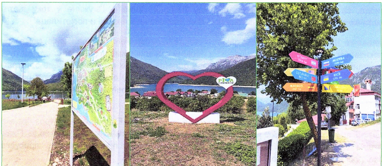
Фотографија 3: Нова мала туристичка инфраструктура у Плужинама постављена 2025.

У 2025. спроведене су и активности на уређењу мале туристичке инфраструктуре у Плужинама, а у оквиру задатака локалне туристичке организације: постављен оквир за фотографисање, смјерокази ка свјетским градовима, постављена је туристичка мапа Плужина на двије локације (на градској плажи и у близини амфитеатра).