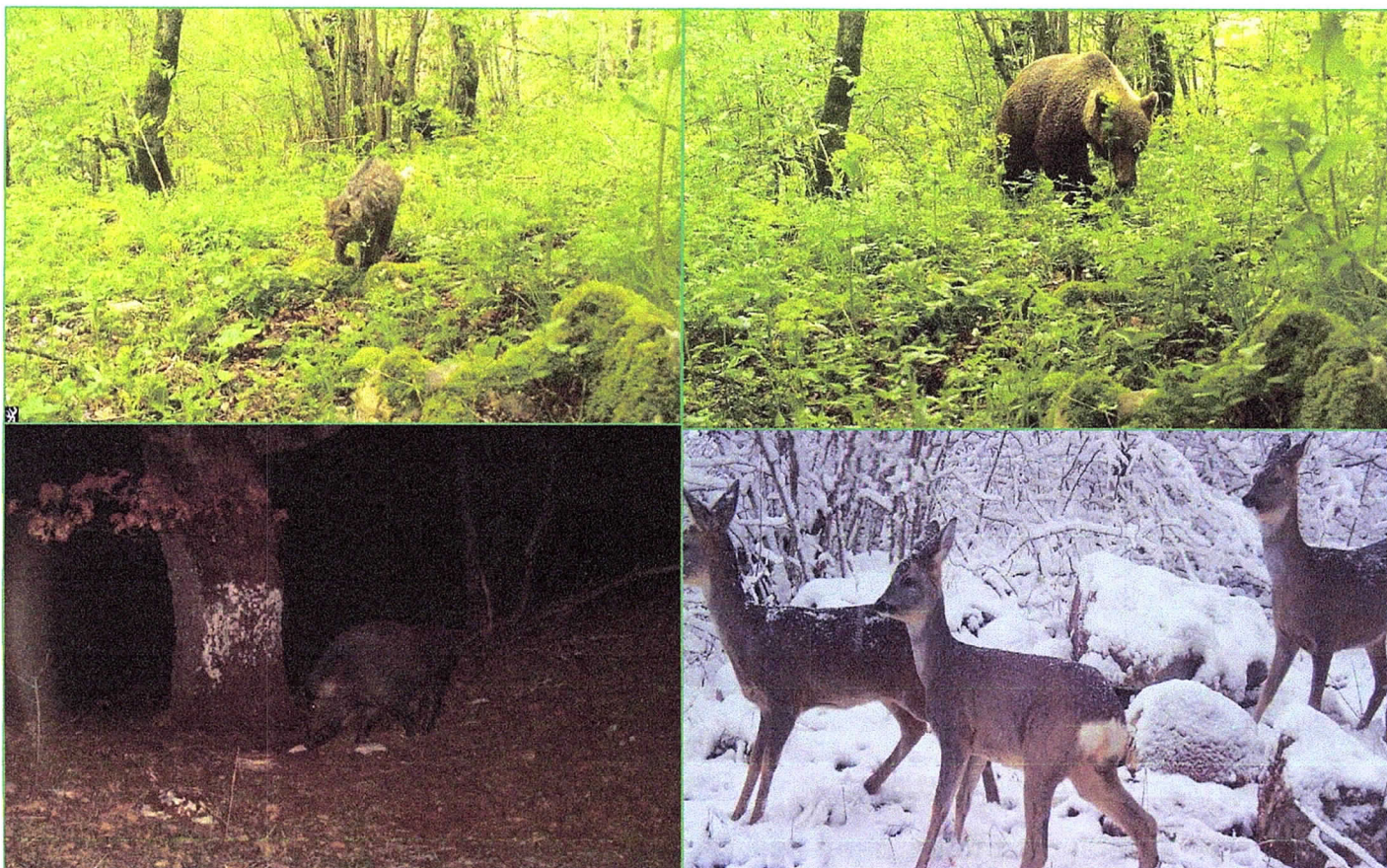
Фотографија 2: Дивља мачка ( Felis silvestris ), мрки медвјед ( Ursus arctos ), дивља свиња ( Sus scrofa ), срна ( Capreolus capreolus ) снимљени у Парку природе „Пива“ 2025.

У Плужинама је у јуну 2025. године одржан састанак представника Министарства пољопривреде, шумарства и водопривреде Црне Горе, Ловачког савеза Црне Горе, СРК Бајо Пивљанин и Парк природе Пива, у циљу координације активности у вези са управљањем популацијом мрког медвједа ( Ursus arctos ) . Влада Црне Горе у јуну 2024. године донијела План газдовања мрким медвједом, док је у априлу 2025. године усвојен и Акциони план за 2025. годину, са роком важења од 1. априла 2025. до 31. марта 2026. године, којим су дефинисане приоритетне мјере у текућој ловној 2025/26. години. Такође, настављено је учешће надзорника Парк природе Пива у интервентном тиму за реаговање у случајевима појаве конфликтних ситуација са мрким медвједом.