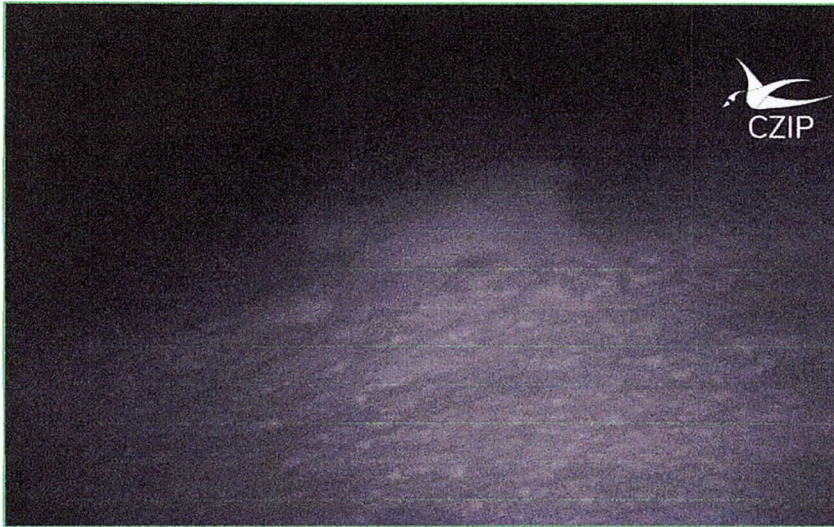
Фотографија 1: Рис ( Lynx ) снимљен у Парку природе Пива 2025.

станишта и стабилне екосистеме. Као кровни предатор, рис има кључну улогу у одржавању природне равнотеже. Резултати мониторинга потврђују значај континуираних мјера заштите природе. Евидентирање риса, такође доприноси бољем разумијевању његове распрострањености. Добијени подаци послужиће као основа за даље планирање мјера заштите а мониторинг великих звијери биће настављен и у наредном периоду.