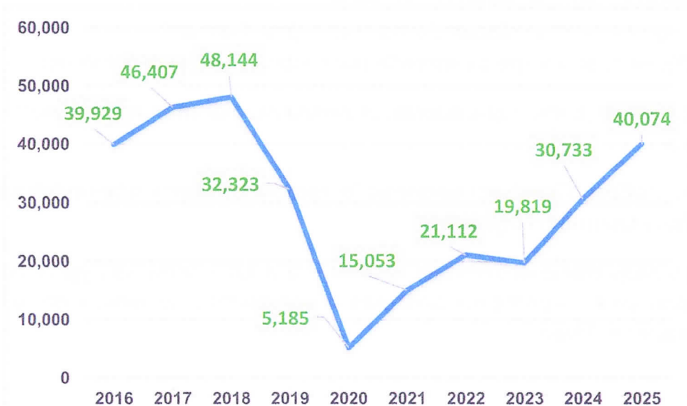
Графикон 1: Број посјета Парку природе „Пива“ 2016-2025.

Такође, број посјета из 2025. је премашио 2019. годину која се најчешће узима за репер прије почетка пандемије корона вируса. За 10 година од проглашења заштићеног подручја, евидентирано је 298.779 посјета.